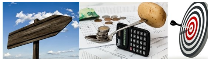
Perspektiven entfalten Haushaltsplanung Begleitung neue Ziele