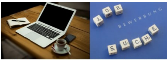
Bewerbung Jobsuche Rat holen Ideen entwickeln